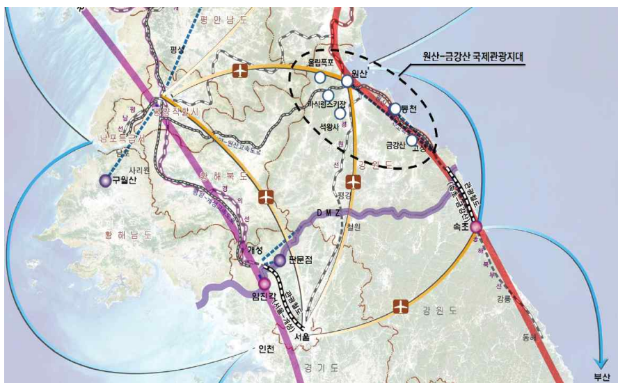
<그림 2> 원산-금강산 국제관광지대

원산-금강산 국제관광지대의 한 축에는 원산이 자리하고 있다. 원산은 원산항 개항 및 경원선철도 개통으로 일제 강점기부터 교통의 요지였는데, 최근 2시간 내에 평양에 닿을 수 있는 평양원산고속도로 개통 및 원산갈마국제공항 리모델링 완료 등으로 그 중요성이 증가하였을 뿐 아니라 향후 시베리안 철도(TSR)까지 연결된다면 주요 물류거점으로 성장 가능성이 매우 높은 지역이다. 원산 지구에는 송도원, 장덕도, 명사십리 등 주요 관광자원과 약 1,300실 규모의 호텔급 숙박시설을 갖추고 있으며, 반경 50Km 이내에 마식령스키장지구, 울림폭포지구, 석왕사지구의 풍부한 관광자원이 분포하고 있다. 이렇듯 원산은 풍부한 관광자원, 교통접근성, 주요시장에의 접근성 측면에서 강점을 가지고 있어 김정은 국무위원장 집권 이래 계획도시로 개발하기 위해 적극적인 개발과 투자유치가 추진되고 있다.