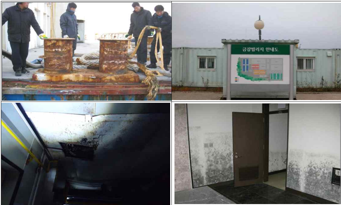
<그림 2> 금강산관광지구의 남측 시설물

이와 같은 김정은 국무위원장의 발표는 김대중 대통령과 김정일 국방위원장이 2000년 공식 발표한 6.15남북공동선언 제4항“남과 북은 경제협력을 통하여 민족 경제를 균형적으로 발전시키고 사회·문화·체육·보건·환경 등 제반 분야의 협력과 교류를 활성화하여 서로의 신뢰를 다져 나가기로 하였다”와 이 합의 사항에 반하는 것이다. 뿐만 아니라 6.15남북공동선언을 바탕으로 2018년 8월 이루어진 평양공동선언 2조 2항에 의하면 남과 북은 상호호혜와 공리공영의 바탕위에서 교류와 협력을 더욱 증대시키고, 민족경제를 균형적으로 발전시키기 위한 실질적인 대책들을 강구해나가기 위해 “조건이 마련되는 데 따라 개성공단과 금강산관광 사업을 우선 정상화 하고(중략)”라고 명시되어 있는데 김정은 국무위원장의 발언은 이 조항을 스스로 깨는 것이라 할 것이다. 결과적으로 북한당국은 이날 개성공단과 함께 남북관계의 상징적 ‘안전판’이자 잠재적 ‘연결고리’인 금강산관광에서 더 이상 남측과 함께 할 수 없다고 선을 그음으로써 최근 일련의 남·북·미 정상회담을 통해 형성되었던 금강산관광 재개에 대한 희망은 우리 정부가 금강산관광 재개를 적극적으로 추진하겠다는 의지 표명에도 불구하고 당분간 불확실한 것으로 판단된다.