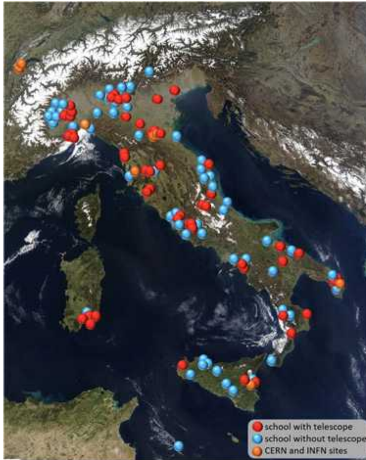
<그림 3> 이탈리아의 고등학교들에 설치된 EEE 망원경의 위치